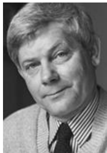
Zbigniew Herbert (1924–1998) – poeta, eseista, dramaturg.

Zbigniew Herbert, Pan Cogito a ruch myśli , [w:] tegoż, Pan Cogito , Warszawa 1974.