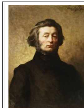
Adam Mickiewicz (1798–1855) – jeden z najwybitniejszych polskich poetów, działacz polityczny, publicysta.

Uciekłem z kraju! Gdziem nie by!! com nie cierpia!!